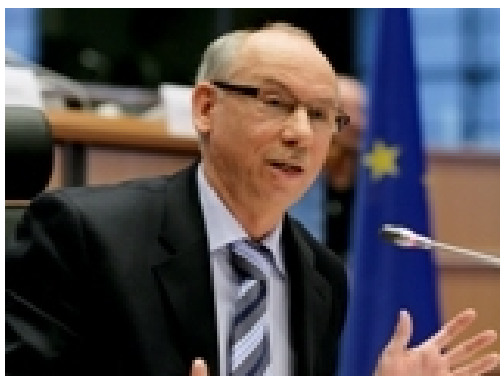
Fot. Komisarz J. Lewandowski

Druga sprawa, o której chcę napisać, w pewnym sensie wiąże się z tym, o czym pisałem wyżej. 27 czerwca br. ukazało się oświadczenie Janusza Lewandowskiego, polskiego komisarza UE. Píše w nim: „...w związku z nieporozumieniami dotyczącymi mojego stanowiska wobec problemu zmian klimatu oświadczam, że nigdy nie twierdziłem, że emisje antropogenne nie są przyczyną zmian klimatu (...), jako komisarz UE będę w pełni popierał realizację strategii Europa 2020 i jej celów środowiskowych, w tym także dotyczących redukcji emisji dwutlenku węgla. Jako swoją odpowiedzialność traktuję zapewnienie odpowiednich funduszy na realizację tej strategii. Głęboko wierzę także, że powstrzymanie zmian klimatu zależy od podjęcia zdecydowanych międzynarodowych działań, włączając w to największych, globalnych emitentów CO 2 ...”.